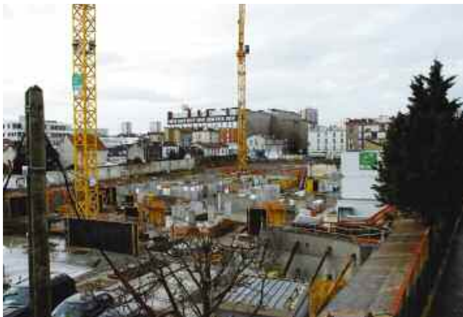
Le chantier Apri-Ionis : le renouveau d'un site

«Avoir un tissu d'entreprises stable et varié est important.»