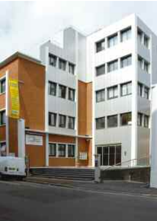
Exemple de transformation de locaux, rue Avaulée.

une forte tertiarisation de l'économie locale. En 1995, 52 % des emplois sur l'agglomération appartenaient au secteur tertiaire et 36 % au secteur industriel. En 2005, la tendance s'accroît avec 72 % des emplois dans le tertiaire et 18 % dans l'industrie. Cette évolution est d'ailleurs conforme aux communes de la proche banlieue. En 2008, pour la ville de Malakoff, on estime le nombre d'emplois à 10 691 dont 67 % sont des emplois dans le secteur des services et 5 % dans le secteur de l'industrie.