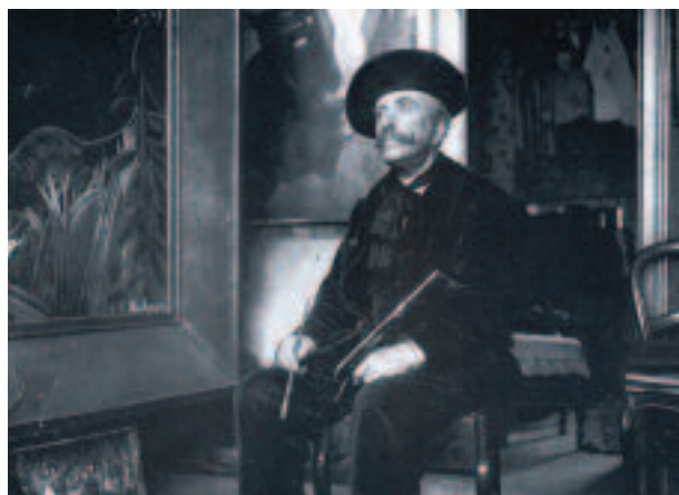
Le Douanier Rousseau, dans son atelier de Montparnasse, vers 1907

Paysages de Malakoff. Notre ville a toujours accueilli de nombreux artistes et en est fière. Saviez-vous que certains peintres l'ont prise pour modèle ? Malakoff infos vous invite à découvrir (ou retrouver) les paysagistes qui ont fixé sur leurs toiles la mémoire de notre ville.