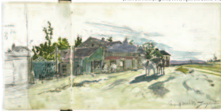
Route bordée de cabarets et de baraques en bois : la porte de Vanves, Johan Barthold Jongkind, 1860, aquarelle 21X43 cm,