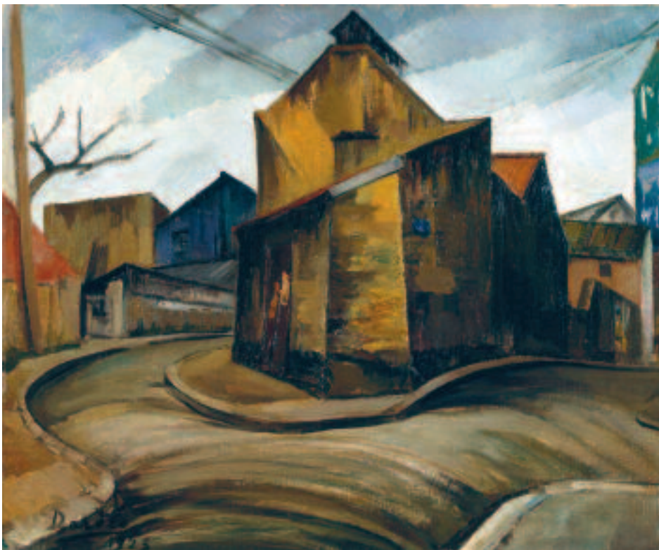
En 1921, Dórdio Gomes livre cette vision moderniste de maisons de Malakoff, situées probablement sur une partie de la rue Voltaire aujourd'hui occupée par une station service et des logements sociaux.