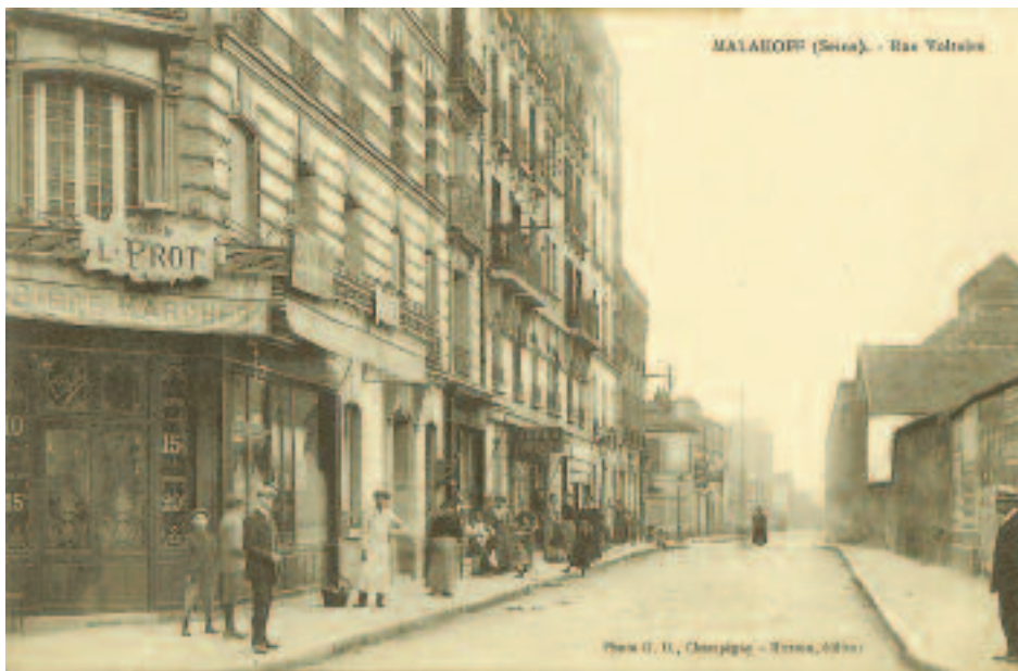
À droite de cette vieille carte postale, le quartier de la rue Voltaire a sans doute servi de modèle à Dórdio Gomes. Le peintre se serait tenu au fond de la rue, à l'opposé du photographe.