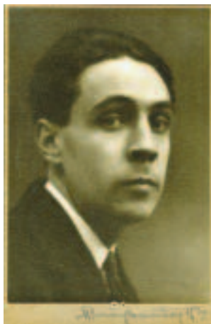
Simão Cesar Dórdio Gomes, peintre moderniste portugais