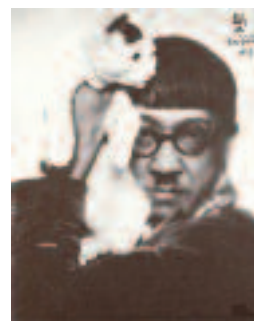
Léonard Tsuguharu Foujita, peintre des femmes et des chats