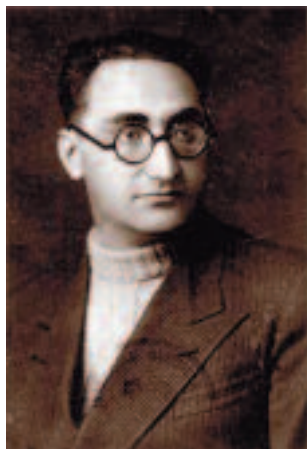
Kosta Hakman, 1928-1961