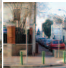
En 80 ans, la rue Chauvelot (vue depuis son intersection avec la rue Gambetta) n'a guère changé.

transparence des toiles de ce peintre de l'atmosphère annonçaient en effet la vague impressionniste de la fin du XIX ème siècle.