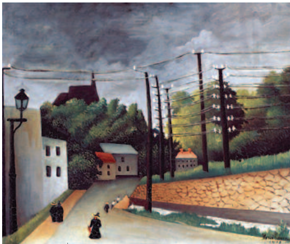
Vue de Malakoff, Henri Rousseau (dit le douanier), 1908, huile sur toile 46X55 cm

Pour une habitante du quartier, c'est une certitude : cette Vue de Malakoff représente la rue Arblade (alors avenue du Chemin de fer). Au fond à gauche, le toit de la chapelle du pensionnat Notre-Dame de France. A droite, le mur de soutènement de la ligne Paris-Versailles.