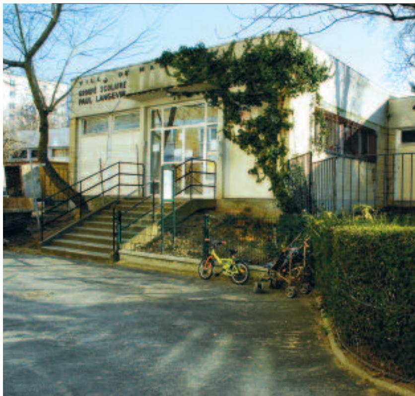
Construction programmée de nouveaux locaux à l'école Paul Langevin, après travaux de confortation des carrières.