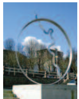
Sculpture pour la clinique de Coutance.