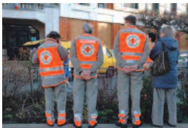
La Croix-Rouge et les nombreux bénévoles assuraient l'encadrement et la sécurité des courses.